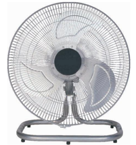
Floor fan 趴地扇